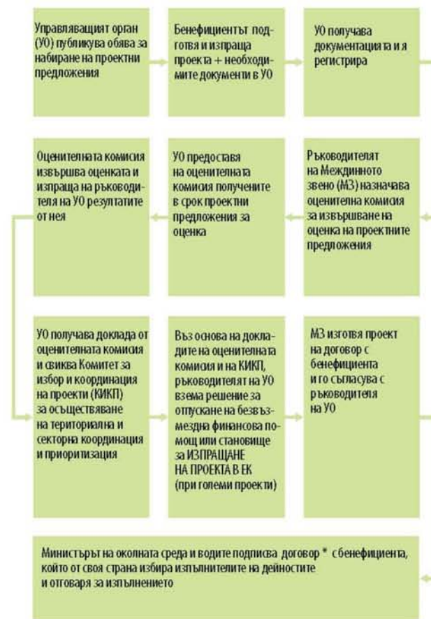
Схема 1. Процедура за кандидатстване и избор на проекти.

Бенефициентите, които желаят да кандидатстват за финансиране по оперативна програма "Околна среда 2007-2013 г.", следва да са запознати с процедурите за кандидатстване, оценка и избор на проекти, а също така и със схемата за предоставяне на финансова помощ. Начинът, по който се кандидатства за финансиране по оперативната програма е представен на схема 1.